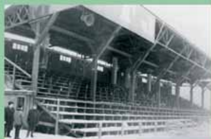
Loučení se stadiem v Brně, 1968