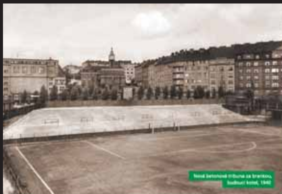
Nová zástavba v Brně u Brankova, budova letní, 1940