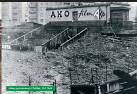
Náklady postupně v Dostálek, 14.3.1945