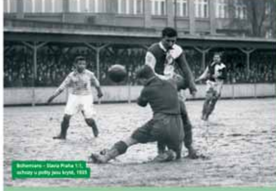
Bohemians – Slavia Praha 1:1, osvětlení u góltů jsou kryté, 1955