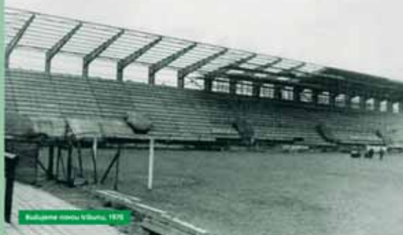
Budování stadiu v Brně, 1976