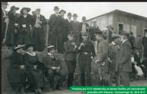
Prostory pro V.F. němečanky ve starém Dolíčku při mezinárodní premiéře AFK Vršovice - Simmeringer SC, 30.8.1917