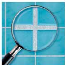
Spárovací hmota Ceresit s recepturou MicroProtect