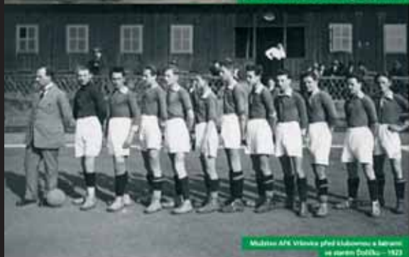
Mužstvo AFK Vršovice před klubovou a hřištěm ve starém Dolíčku - 1923