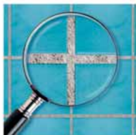
Běžná spárovací hmota

Spáry zůstanou čisté a krásné na opravdu dlouhou dobu!