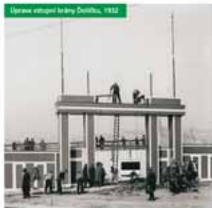
Ústava vstupní brány Dolíček, 1932