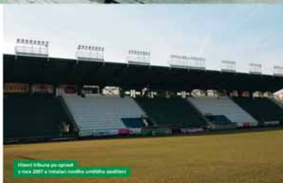
Stadión v Brně po opravě v červnu 2007 a vzhledem nově instalované sedadla