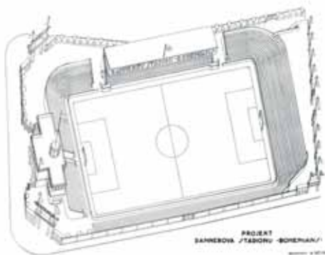
Projekt nového Germanova stadionu Bohemians, stánek z roku 1932

Do roku 1914 neměl AFK Vršovice vlastní hřiště, své zápasy hrál u soupeřů nebo na vypůjčených plochách