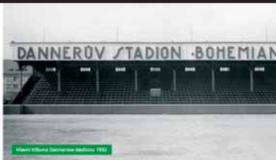
Hlavní tribuna Dannerova stadionu 1932

V roce 1930 z iniciativy předsedy klubu Zdeňka Danneru, ředitele Občanské záložny ve Vršovicích vznikl záměr postavit nový stadion u Botiče, v okrajové části Vršovic