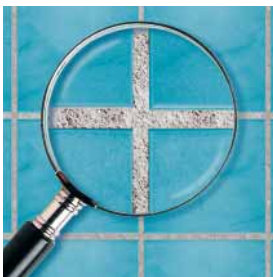
Běžná spárovací hmota

Spáry zůstanou čisté a krásné na opravdu dlouhou dobu!