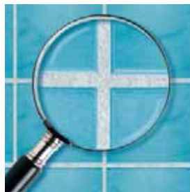
Spárovací hmota Ceresit s recepturou MicroProtect