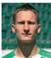
Milan Škoda 21 16. 1. 1986 útočník 80 kg, 190 cm